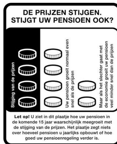
Figuur 2. Voorbeeld van het Toeslaglabel plaatje.

Het plaatje in Figuur 2 laat aan de hand van muntjes zien in welke mate de pensioenen de komende 15 jaar vermoedelijk groeien met de prijsstijgingen (tweede stapel muntjes). Ook laat het plaatje zien hoe de pensioenen stijgen in het geval het economisch tegen zit (derde stapel). De stapel muntjes in de linkerkolom dienen als referentie. Deze kolom bevat altijd vier muntjes, die de verwachte prijsstijging representeren.